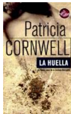
Portada de La huella.

La nueva colección aspira a tener en el mercado unos 150 títulos, un tercio de ellos inéditos, y estará dirigida al lector joven, con poder adquisitivo medio y asiduo de las librerías, es decir, el perfil habitual del comprador de los libros de bolsillo y también de Internet, lo que le vincula con el bookcrossing , sistema escogido como parte de la campaña de lanzamiento, que también